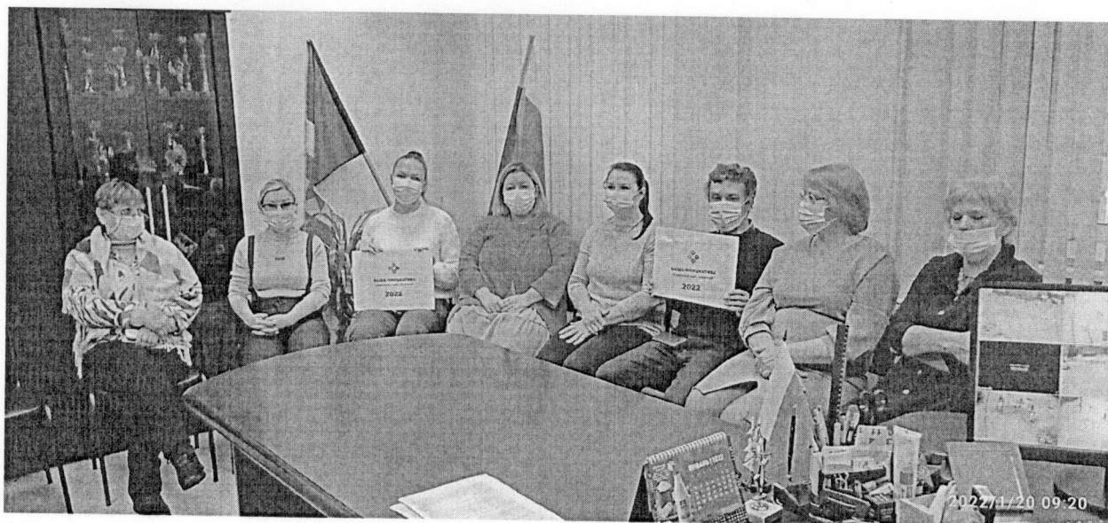
Фото итогового собрания жителей многоквартирного дома 20 по улице Сабурова села Первомайский Завьяловского района Удмуртской Республики по определению параметров инициативного проекта и источникам его финансирования